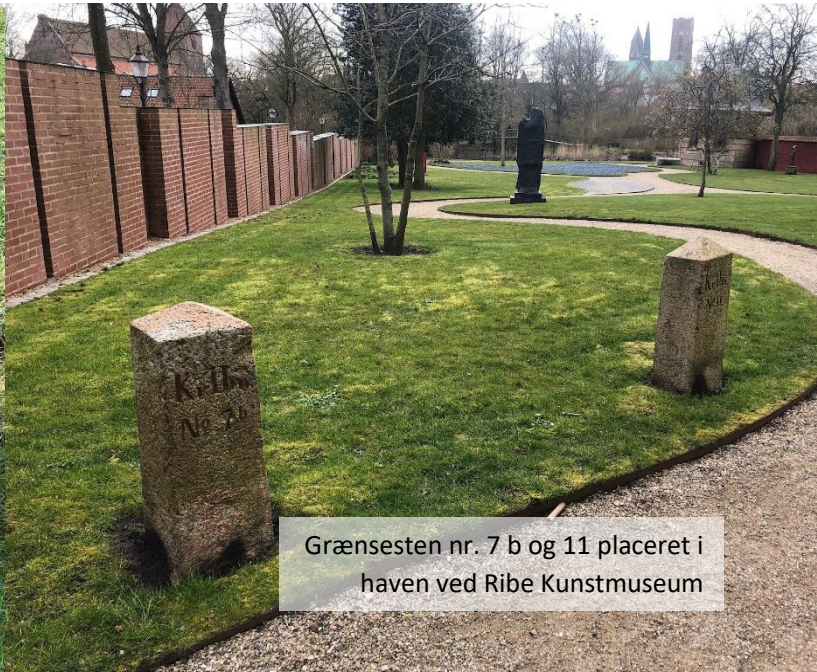
Grænsesten nr. 7 b og 11 placeret i haven ved Ribe Kunstmuseum